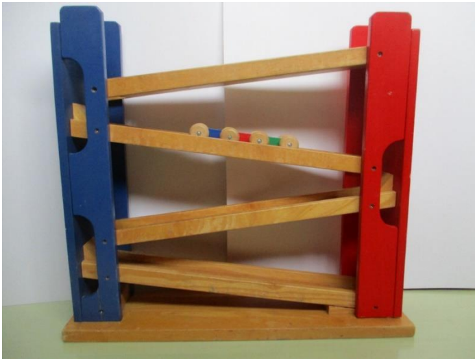
追視のおもちゃ（クーゲルバーン）