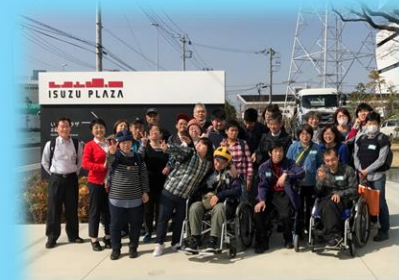
公共交通機関遠足 いすゞプラザにて